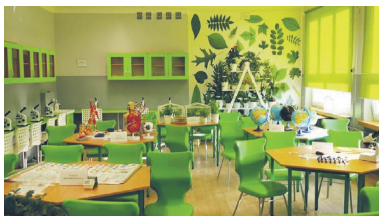
Uczniowie Szkoły Podstawowej Nr 10 w Wodzisławiu Śląskim mogą już korzystać z nowoczesnej zielonej pracowni.

„Zielona Pracownia Projekt'2019” oraz „Zielona Pracownia'2019”. Oba mają służyć powstawaniu w szkołach podstawowych i średnich ekopracowni. To miejsca, gdzie uczniowie poprzez doświadczenia i badania przeprowadzane dzięki nowoczesnemu sprzętowi poznają prawa i procesy rządzące przyrodą. Wsparcie Funduszu pozwala na kupno sprzętu, odczynników, wyposażenia i materiałów edukacyjnych. Dzięki konkursowi wsparcie finansowe na budowę ekopracowni otrzymało do