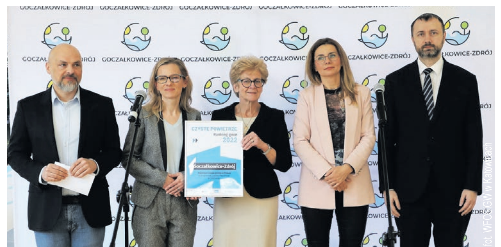
fol. WFOŚiGW w Katowicach

portu paliw kopalnych. Aktywny udział samorządów w programie ma kluczowe znaczenie. Tam, gdzie władze lokalne działają sprawnie, tam widać efekty w postaci liczby wymienionych kopciuchów i ocieplonych domów - dodaje Andrzej Guła , lider Polskiego Alarmu Smogowego.