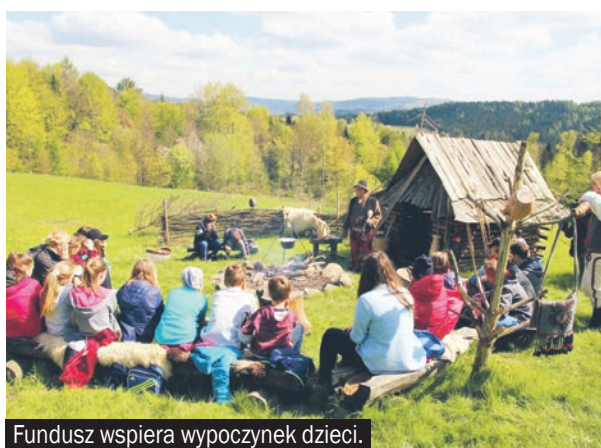
Fundusz wspiera wypoczynek dzieci.

12 uczniów z Zespołu Szkół nr 9 w Jastrzębiu-Zdroju skorzysta z dotacji z Wojewódzkiego Funduszu Ochrony Środowiska i Gospodarki Wodnej w Katowicach i pojedzie na „zieloną szkołę”.