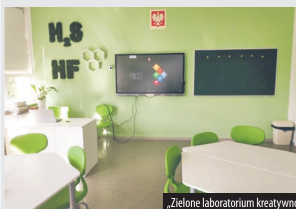
„Zielone laboratorium kreatywności” w Szkole Podstawowej z Oddziałami Integracyjnymi nr 5 imienia Władysława Broniewskiego w Jastrzębiu-Zdroju.

W tym roku zielone pracownie powstają prawie w każdym powiecie. Wzbogacają się o nie szkoły w dużych miastach: Katowicach, Bytomiu czy Zabrze, ale także w małych miejscowościach naszego województwa, m.in. szkoła w Goleniowach, Ornowicach czy Koniakowie.