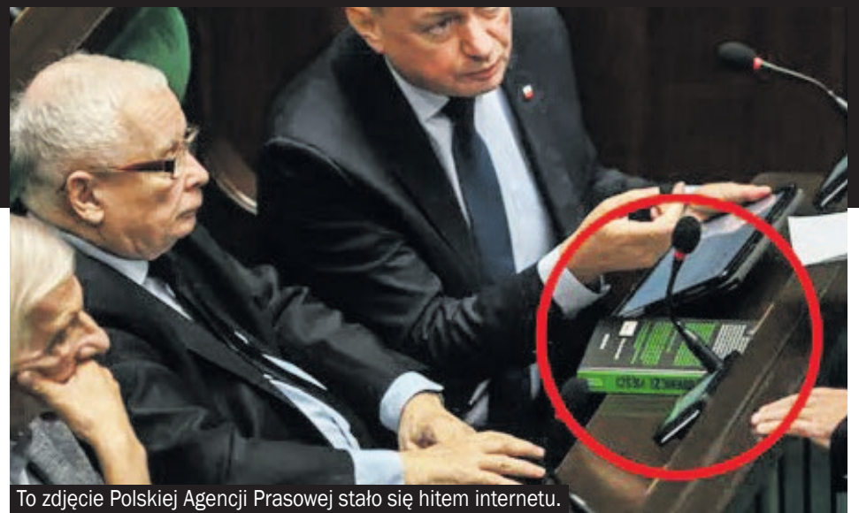
To zdjęcie Polskiej Agencji Prasowej stało się hitem internetu.