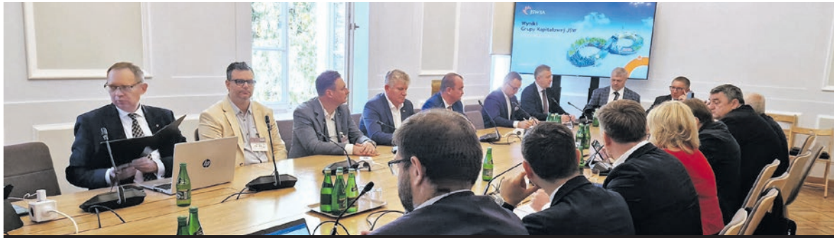
O JSW debatowano podczas posiedzenia Parlamentarnego Zespołu ds. Energetyki oraz Transformacji Energetycznej i Górnictwa w Polsce.