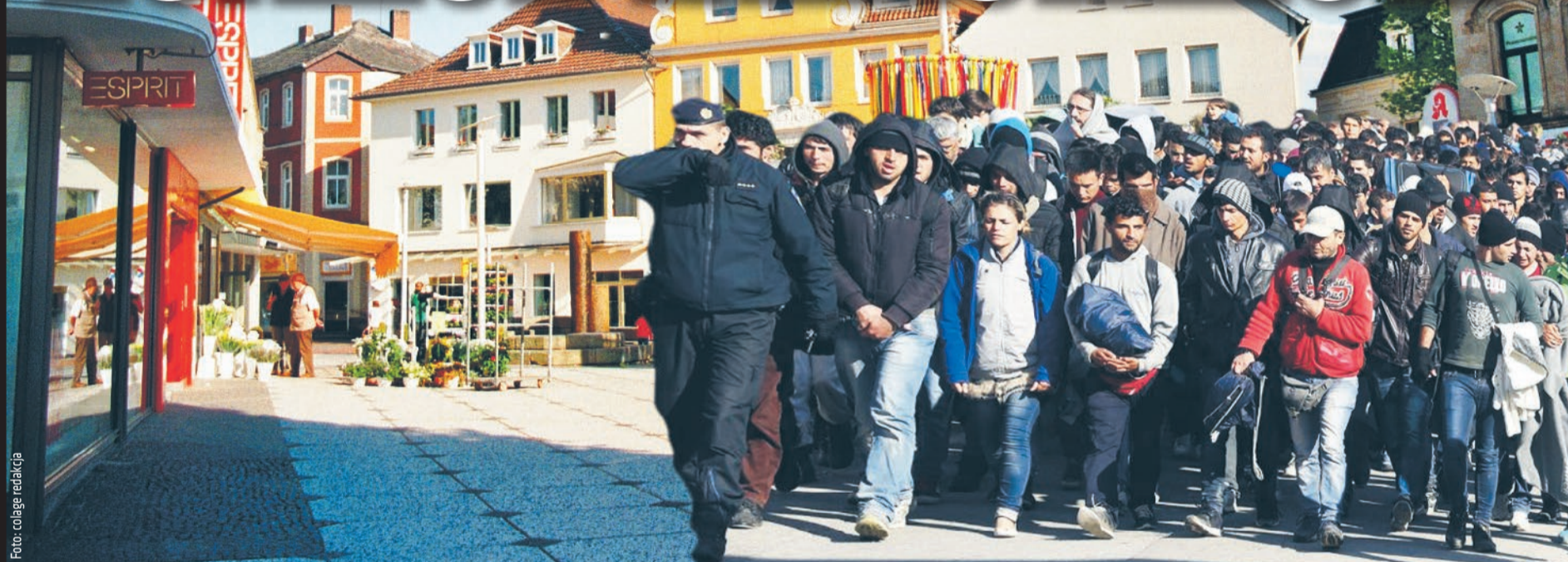
Skończyły się dobre czasy dla Ibbenbüren

Jastrzębscy samorządowcy lubią się chwalić dobrymi relacjami z niemieckim partnerem. Tam wszystko było na wysokim poziomie i zorganizowane jak w zegarku. Jak to u Niemców. Mieli kasę, to mogli imponować polskim kolegom udanym projektem rewitalizacyjnym i budową nowoczesnego, lecz pełnego uroku centrum miasta. Ale chyba kończą się dobre czasy dla Ibbenbüren. Wszystko z powodu gościnności niemieckiej „cesarskiej”, czyli kanclerz Angeli Merkel. Kto włada językiem Goethego i Schillera, tego zachęcamy do lektury portali i forów internetowych poświęconych jastrzębskiemu partnerowi. Nie polecamy strony urzędowej, bo w spletnych poprawnością polityczną Niemcech, jej lektura może wydać się nadęta, niestrawna i sterowana pod potrzeby ogólnokrajowej polityki.