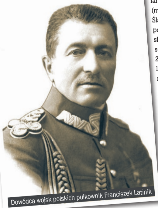
Dowódca wojsk polskich pułkownik Franciszek Latinik

Cały artykuł o polsko-czeskiej wojnie został opublikowany w nr 1-2/2016 miesięcznika Wojna REVUE, który do 7 lutego można kupić w punktach sprzedaży prasy.