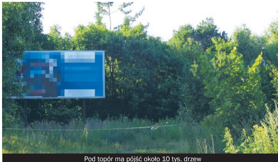
Pod topór ma pójść około 10 tys. drzew

N ie zważając na zażalenie prokuratury oraz Górnośląskiego Towarzystwa Przyrodniczego na postępowanie administracyjne dotyczące budowy hipermarketu budowlanego i galerii handlowej w tzw. strefie centrum inwestor wystąpił z wnioskiem o wycinkę drzew.