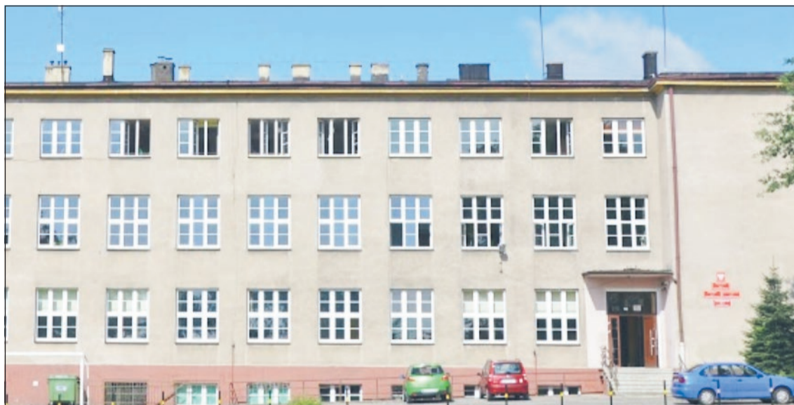
Metan z lokalnych ujęć, dzięki Jastrzębskiej Spółce Węglowej, ogrzeje szkołę.

Grupa Kapitałowa JSW będzie się rozwijać w oparciu o nowoczesne technologie, tak by jak najefektywniej wykorzystywać złoża węgla i jak najmniej szkodzić środowisku naturalnemu. Strategia zakłada, m.in. wdrożenie carbon footprint, programu pomiaru i ograniczenia emisji