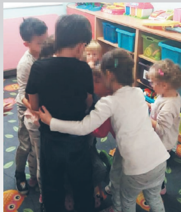
Największym pokrzywdzonym w tej sytuacji są niepełnosprawne dzieci.

Niepubliczna Specjalistyczna Poradnia „Centrum Logopedyczne” działa w Jas-