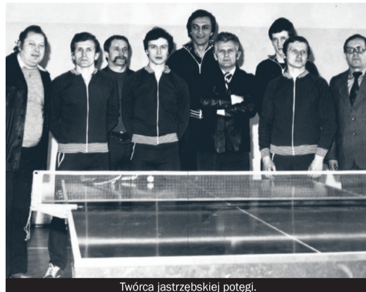
Twórca jastrzębskiej potęgi.