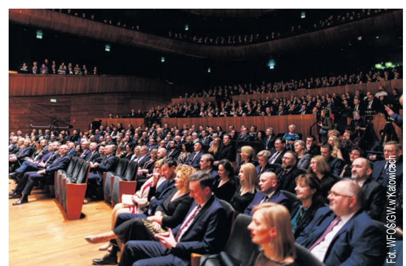
W sali koncertowej katowickim NOSPR zgromadzili się pracownicy Funduszu, by świętować 30. rocznicę powstania instytucji.