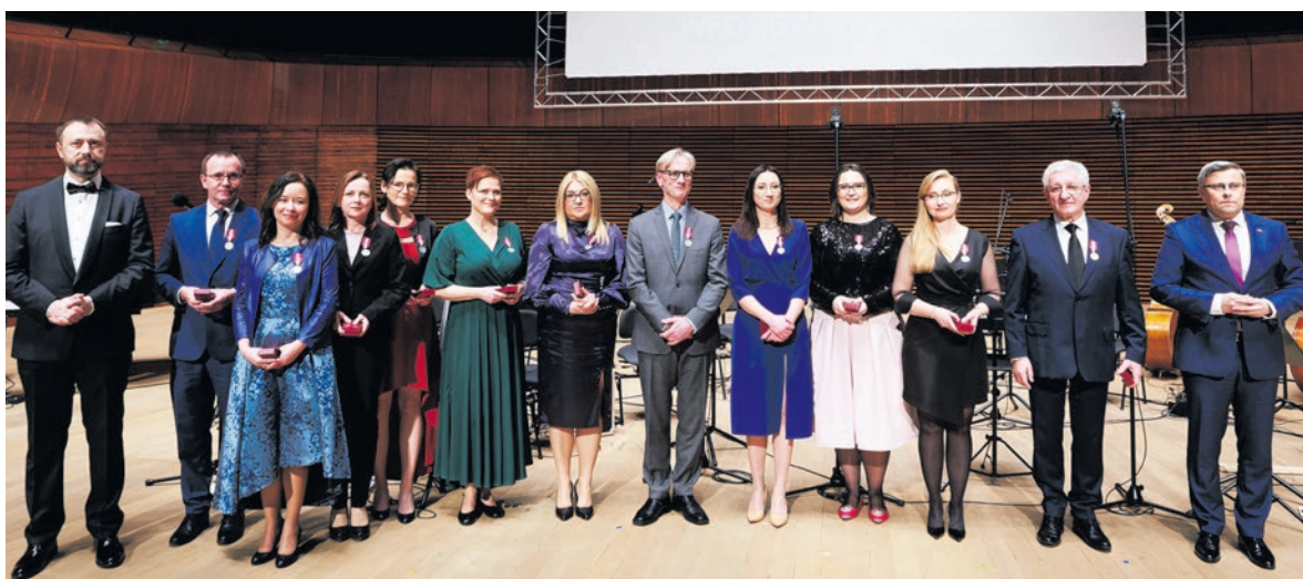
Zasłużeni pracownicy Funduszu otrzymali odznaczenia państwowe przyznane przez Prezydenta Rzeczypospolitej Polskiej oraz odznaki honorowe, przyznane przez Ministra Klimatu i Środowiska.

Mając w pamięci jego słowa jesteśmy świadomi, że nie wszystko zostało zrobione i wiele pracy przed nami wszystkimi. Niezależnie od wszystkiego.