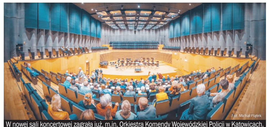
W nowej sali koncertowej zagrała już, m.in. Orkiestra Komendy Wojewódzkiej Policji w Katowicach.