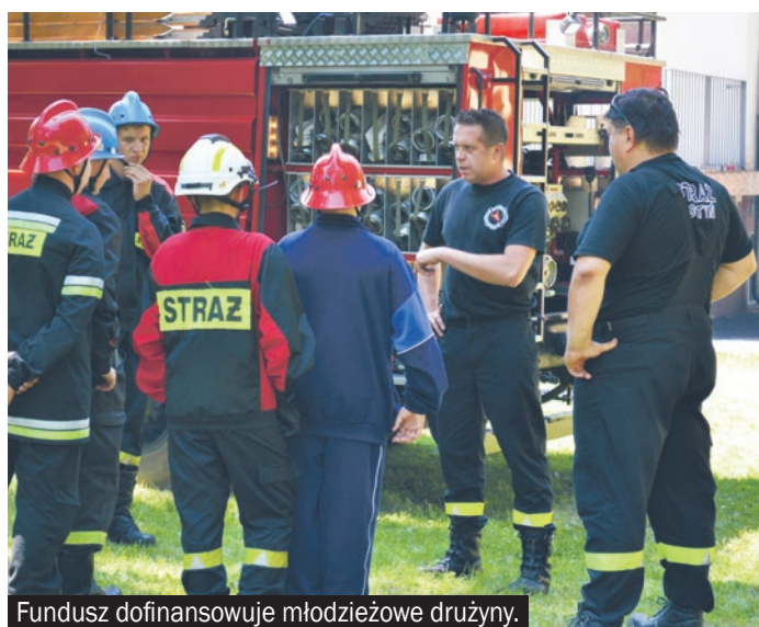
Fundusz dofinansowuje młodzieżowe drużyny.

Fundusz wspiera, m.in. zakup sprzętu ratowniczego dla jednostek służb ratowniczych z terenu województwa śląskiego. Formą dofinansowania jest tu dotacja w wysokości do 100% kosztów kwalifikowanych, a pula środków na dofinansowanie wynosi 2 mln zł. Wnioski można składać do 16 maja.