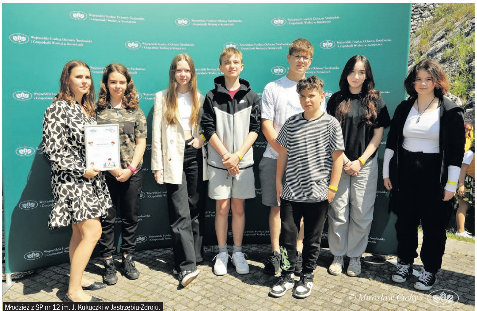
Młodzież z SP nr 12 im. J. Kukuczki w Jastrzębiu-Zdroju.

Zielona Pracownia „EKOenergia i EKOmateria” w SP nr 12 im. J. Kukuczki w Jastrzębiu-Zdroju znalazła się wśród stu najlepszych placówek, które otrzymały dofinansowanie w wysokości 48 tys. zł. Pieniądze przyznane w ramach tego konkursu zostaną wydatkowane na utworzenie szkolnych pracowni (na potrzeby nauk przyrodniczych, biologicznych, ekologicznych, geograficznych, geologicznych czy chemiczno-fizycznych), w szkołach województwa śląskiego.