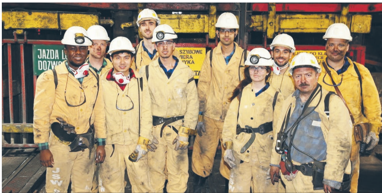
Studenci zjechali na poziom 830 metrów i zapoznali się z rozwiązaniami technicznymi stosowanymi w ścianie B-3.