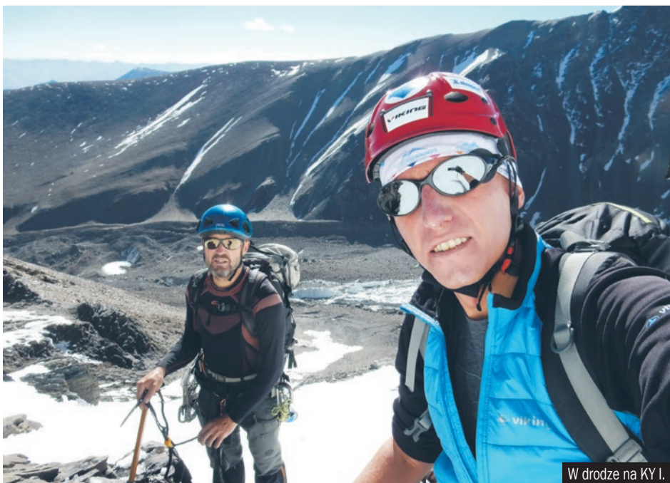
W drodze na KY I.

(6401m) i Kang Yatze II (6210m). Pojawił się tam jako pierwsi Polacy. Oba szczyty leżą blisko granicy z Pakistanem, czyli w strefie zmilitaryzowanej, a to wiąże się z wieloma ograniczeniami. Wspinacze musieli skorzystać z pośrednictwa agencji,