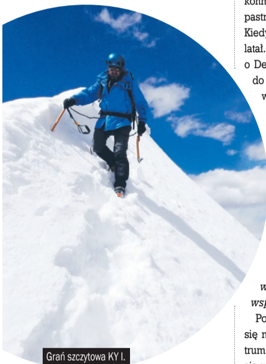
Grani szczytowa KY I.

Po zdobyciu szczytów wrócili do Leh. Wybrali się na zwiedzanie okolicy i znaleźli się w centrum bazy wojskowej. Na szczęście skończyło się na strachu... i uśmiechach żołnierzy. W przyszłym roku Klub Wysokościowy Jastrzębie-Zdrój i Łaziska Grupa Górską planują już w znacznie liczniejszym składzie wyprawę do indyjskiego Kaszmiru i wejścia na siedmiotysięczniki: Nun (7135m) oraz Kun (7077m). Trzymamy kciuki za powodzenie.