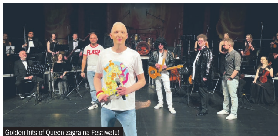
Golden hits of Queen zagra na Festiwalu!