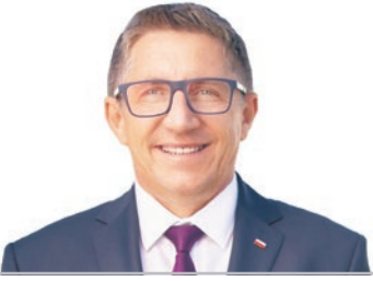
GRZEGORZ MATUSIAK Poseł na Sejm z Jastrzębia-Zdroju

Na razie w wypowiedziach polityków rządzących w Berlinie nic nie wskazuje na jakąkolwiek zmianę w podejściu do polityki migracyjnej. Nadal więc wszyscy przybywający nad Łabę, mogą liczyć na otwarte ramiona niemieckiego systemu socjalnego. Nadal nie ma większego znaczenia, czy dostają się tam z poszanowaniem prawa, czy nielegalnie, korzystając z pomocy białoruskiego satrapy lub przemytników zbijających na tym procederze prawdziwe fortuny.