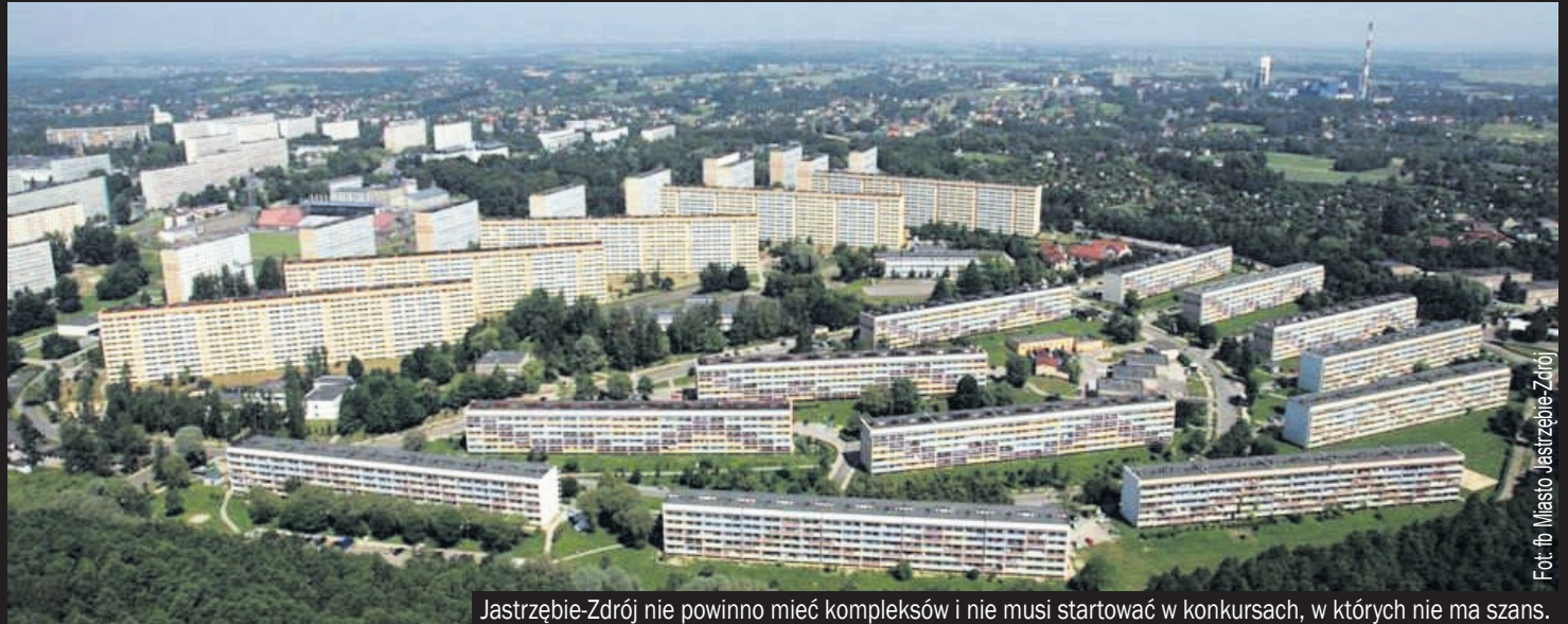
Jastrzębie-Zdrój nie powinno mieć kompleksów i nie musi startować w konkursach, w których nie ma szans.

Do 15 września Jastrzębie-Zdrój musi złożyć oficjalną aplikację, jeśli nadal chce być w 2029 roku Europejską Stolicą Kultury. Na razie, oprócz propagandowych komunikatów płynących z magistratu, nie wiemy nic o konkretnych planach inwestycyjnych i infrastrukturalnych. Wygląda na to, że jedynym atutem w zmaganiach o ten tytuł jest „zuchwałość” prezydent miasta.