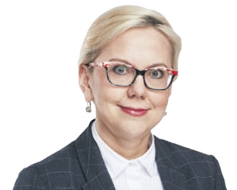
ANNA MOSKWA, minister Klimatu i Środowiska:

► Ruszyła długo wyczekiwana trzecia edycja Programu Narodowego Funduszu Ochrony Środowiska i Gospodarki Wodnej (NFOŚiGW) - „Moja Woda”, który ma pomóc w łagodzeniu skutków suszy i przeciwdziałaniu podtopieniom budynków w Polsce. Właściciele domów jednorodzinnych mogą otrzymać nawet 6 tys. zł dotacji na budowę przydomowych instalacji zatrzymujących deszczówkę. W poprzednich edycjach Programu tylko w województwie śląskim dotacje otrzymało ponad 6 tysięcy Beneficjentów.