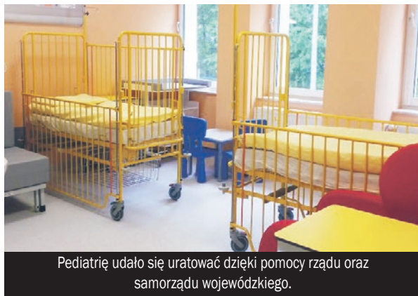
Pediatrę udało się uratować dzięki pomocy rządu oraz samorządu wojewódzkiego.