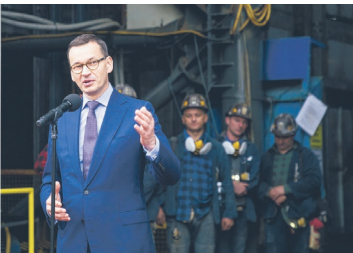
Premier MATEUSZ MORAWIECKI:

W Jastrzębiu-Zdroju oficjalnie zainaugurowała działalność kopalnia węgla kamiennego Jastrzębskiej Spółki Węglowej SA. Głębokość szybu, który zyskał nowe imię „Jan Paweł”