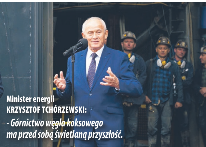
Minister energii KRZYSZTOF TCHÓRZEWSKI:

- Na gospodarkę trzeba patrzeć całościowo. Nie ma nowoczesnej gospodarki bez stali, a nie ma stali bez węgla koksowego. Ta super nowoczesna kopalnia będzie potrzebna Polsce i całej Europie. Trzeba przypomnieć, że węgiel koksowy został uznany przez Unię Europejską za surowiec strategiczny, dlatego należy się cieszyć, że mamy do czynienia z rozbudową tego potencjału.