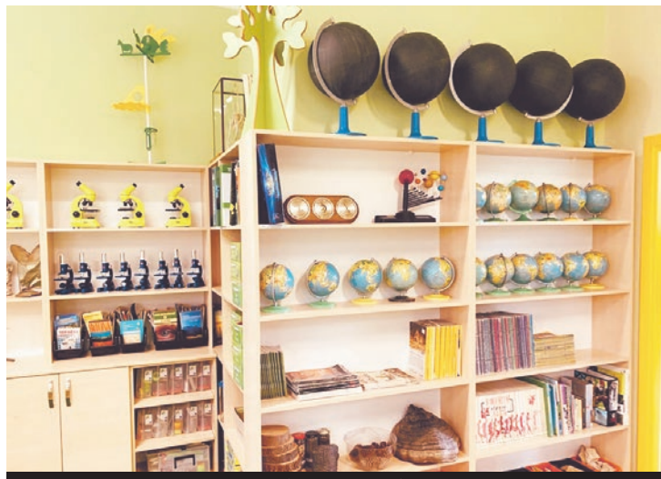
Ekopracownia - „Kraina Odkrywców” w SP w Górze - gmina Mszana.

Dzięki edukacji możemy zmienić sposób myślenia i działania przyszłych pokoleń - stąd akcja Wojewódzkiego Funduszu Ochrony Środowiska i Gospodarki Wodnej w Katowicach wspierania finansowego szkół i samorządów by powstawały ekopracownie. W tym roku na utworzenie 87 zielonych pracowni Fundusz przeznaczył ponad 3 mln zł. Do tej pory dzięki pięciu edycjom konkursów - „Zielona Pracownia Projekt” i „Zielona Pracownia” udało się utworzyć 250 zielonych pracowni, na które Fundusz przeznaczył 8 536 925 zł.