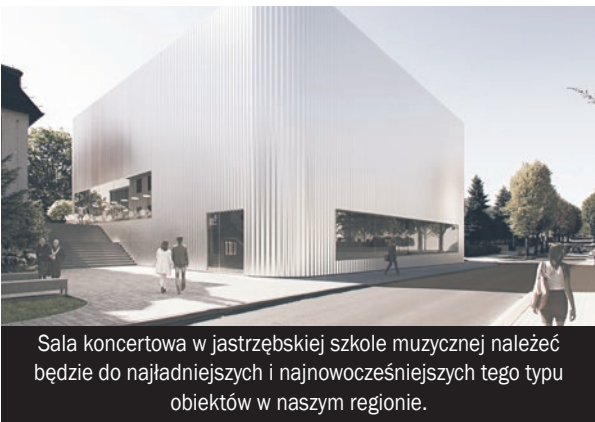
Sala koncertowa w jastrzębskiej szkole muzycznej należy do najładniejszych i najnowocześniejszych tego typu obiektów w naszym regionie.