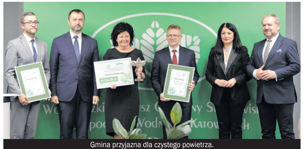
Gmina przyjazna dla czystego powietrza.