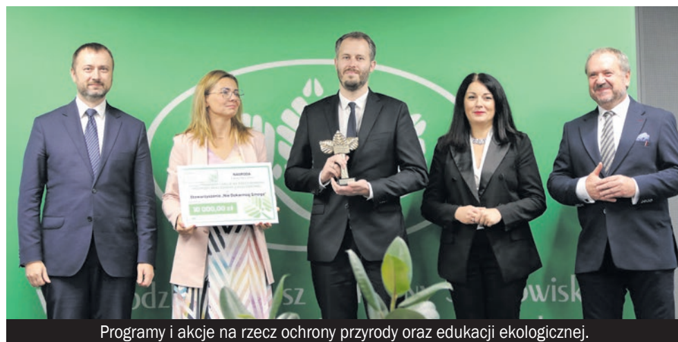
Programy i akcje na rzecz ochrony przyrody oraz edukacji ekologicznej.