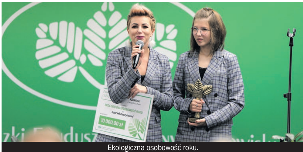
Ekologiczna osobowość roku.