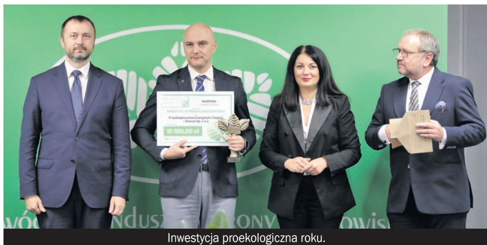
Inwestycja proekologiczna roku.