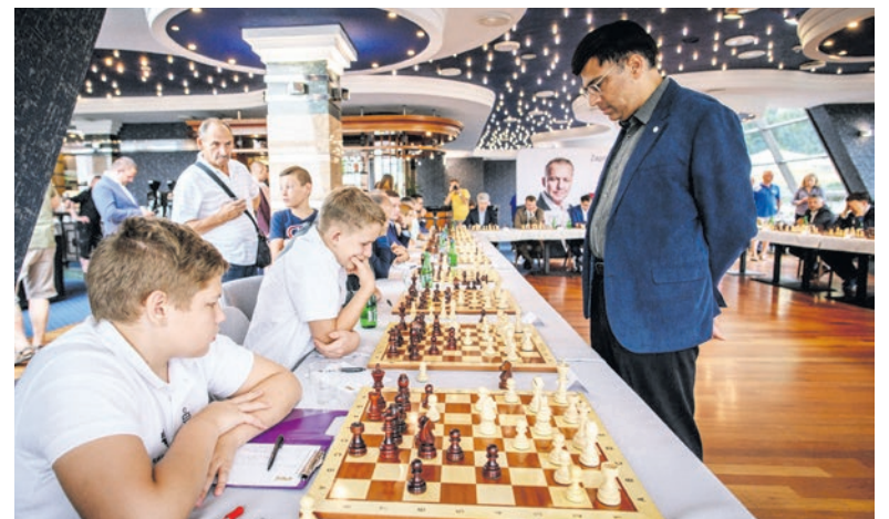
Dla młodych szachistów z naszego partnerskiego miasta Borszczów, udział w turnieju „Szachy łączą pokolenia w Ustroniu” był ogromnym, niezapomnianym przeżyciem. Choć na kilka dni zapomnieli o wojnie.