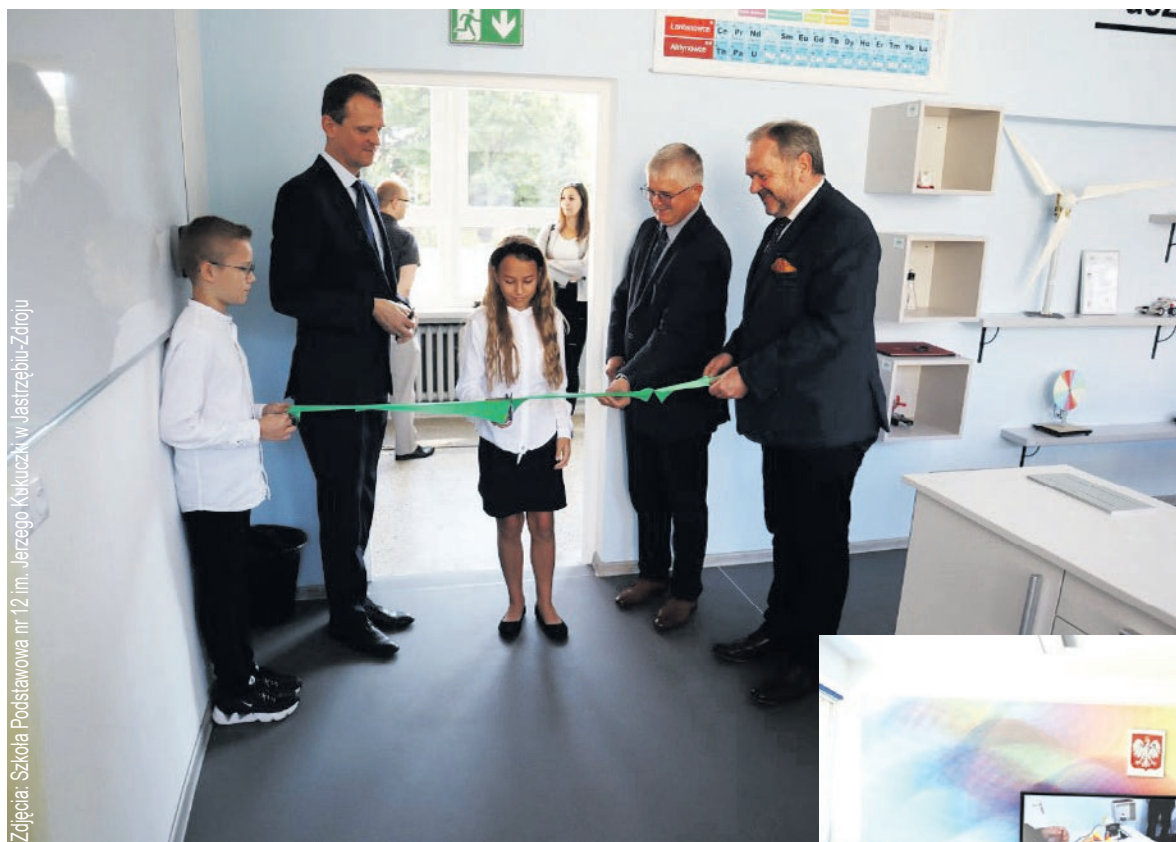
Zdjęcia: Szkoła Podstawowa nr 12 im. Jerzego Kukuczki w Jastrzębiu-Zdroju

- Fundusz cieszy fakt, że dzięki naszemu wsparciu młodzież może poznawać naturę. Zglębiać strukturę cieczy i materii. Badać zjawiska naturalne i rozwijać swoje pasje. Poznawanie poprzez doświadczenie pozwala uczniom lepiej zbadać otaczającą nas przyrodę i z większym szacunkiem po-