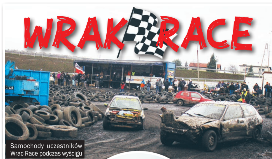
Samochody uczestników Wrak Race podczas wyścigu

W niedzielę na Torze Rajdowym firmy Recyklingowej Auto-Importer przy ul. Pszczyńskiej w Jastrzębiu rozegrano kolejną edycję wyścigu wraków zaliczaną do ogólnej klasyfikacji Wrak Race Cup. Impreza przyciągnęła na start wielu miłośników tego sportu