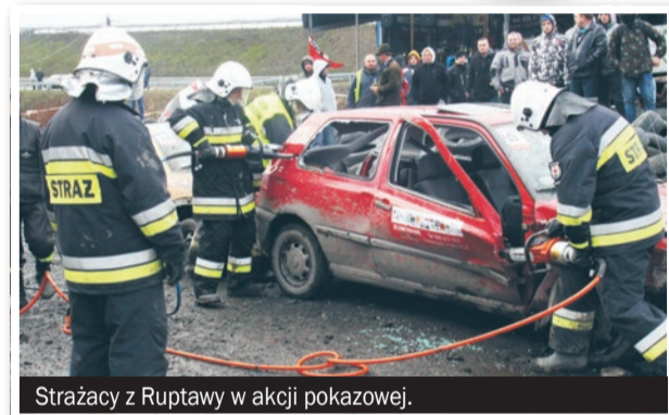
Strażacy z Ruptawy w akcji pokazowej.