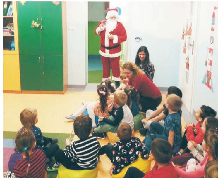
Dla wielu dzieci zajęcia w „Centrum Logopedycznym” są jedyną szansą na normalny rozwój.