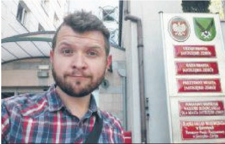
A zdjęcie jest z 31 sierpnia, na pamiątkę, bo był to mój ostatni dzień pracy w urzędzie.

Zainteresowałem się tym tematem i teraz to ja się wypowiem, bo szlag mnie trafia, kiedy czytam odpowiedzi na owe interpelacje, ale także na wiele innych. Oczywiście sama instytucja interpelacji jest skonstruowana w taki sposób, że radny może sobie pytać, a prezydent odpowiadać tak, żeby nie