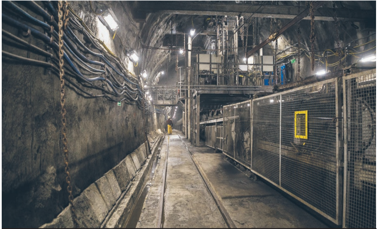
W kopalni Budryk w szybie I na poziomie 1090 uruchomiono nowatorski układ załadunkowy skipów. W zaledwie 20 sekund napełnia 35 tonowy skip. Jest to jeden z elementów inwestycji w „Budowa poziomu 1290”.

Sprzedaż utrzymała się na tym samym poziomie, tj. 2,6 mln t. Przychody ze sprzedaży koksu i węglowodnych w analizowanym okresie