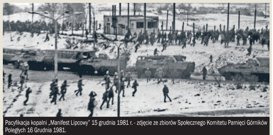
Pacyfikacja kopalni „Manifest Lipcowy” 15 grudnia 1981 r.