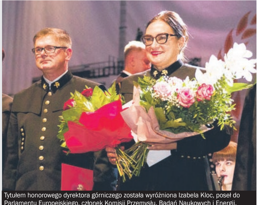
Tytułem honorowego dyrektora górnictwa została wyróżniona Izabela Kloc, poseł do Parlamentu Europejskiego, członek Komisji Przemysłu, Badań Naukowych i Energii.

Na pierwszej linii innowacji jest właśnie Jastrzębska Spółka Węglowa, która realizuje w tym roku wiele ważnych inwestycji. Ich łączna wartość to ponad 2 mld zł. JSW to spółka, która doskonale realizuje swoje plany, a innowacje są tu kapitalnie wykorzystywane poprzez współpracę z zapleczem naukowo-badawczym