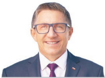
GRZEGORZ MATUSIAK Poseł na Sejm z Jastrzębia-Zdroju