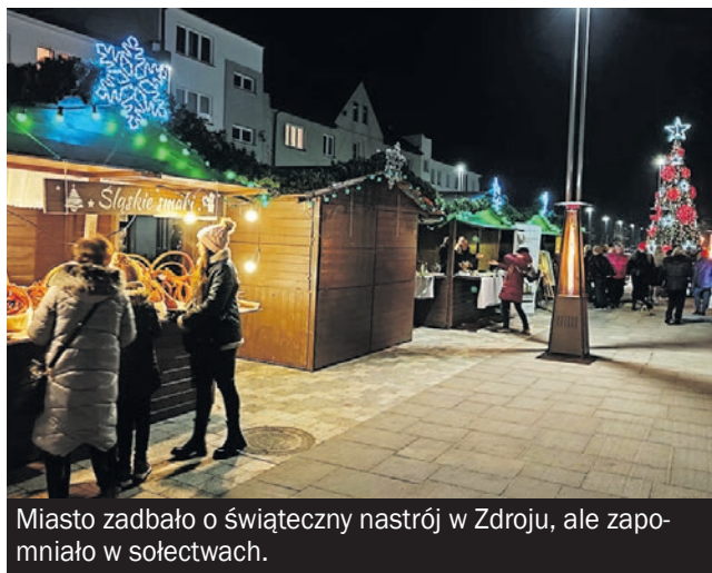
Miasto zadbało o świąteczny nastrój w Zdroju, ale zapomniało w sołectwach.

- Zwracam się do Pani w imieniu mieszkańców naszego miasta z pilną prośbą dotyczącą dekoracji świątecznych w sołectwach. Kolejny raz docierają do mnie sygnały od mieszkańców, którzy wyrażają swoje rozczarowanie brakiem dekoracji na ulicach i osiedlach poza centrum miasta. Nasze mia-